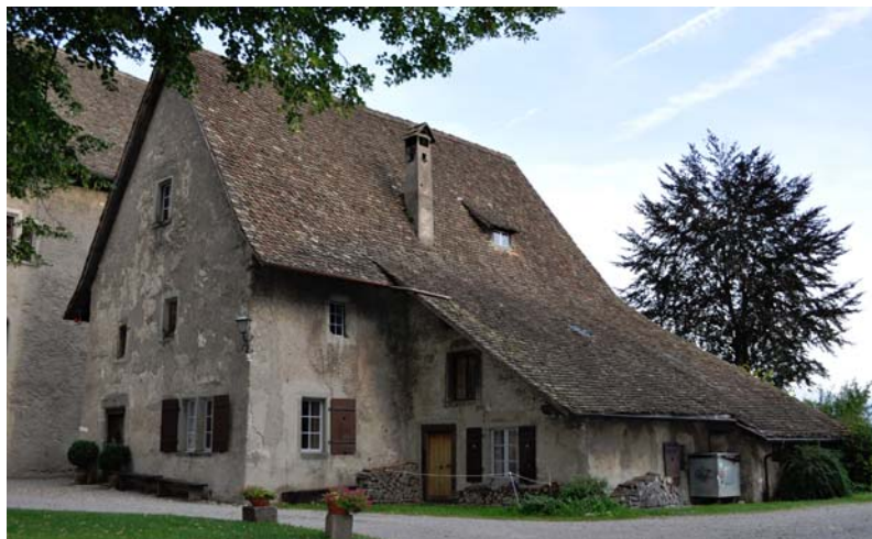
Das Gesindehaus des Ritterhauses soll saniert und für die Öffentlichkeit zugänglich werden

Das Vorhaben der Gemeinde führt dazu, dass aus verschiedenen Quellen Gelder zur Sanierung des Gebäudes gesprochen werden. Dass das Gesindehaus renovationsbedürftig ist, steht ausser Zweifel. Das Projekt leistet ausserdem einen Beitrag an den gesamten Ritterhauskomplex und wertet die ganze Anlage auf. Diesem doch einmaligen Kulturgut Sorge zu tragen, muss unser aller Wunsch sein. Nach der Instandsetzung wird mit dem Gesindehaus der Öffentlichkeit ein weiteres Gebäude des Ritterhauses zugänglich sein.