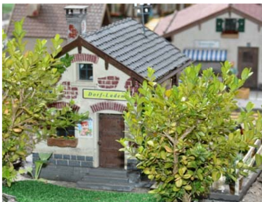
Kennen Sie diesen Dorf-Laden?

Auch dieses Jahr haben wir eine Ferien-Aufgabe für Sie. Dieses Mal vielleicht etwas kniffliger als letztes Jahr. Steigen Sie aufs Velo, fragen Sie vielleicht ältere Leute und finden Sie heraus, wo in unserer Gemeinde der unten abgebildete Dorf-Laden steht. Mit der richtigen Lösung gewinnen Sie mit ein wenig Glück einen Gutschein fürs Café Bolliger (Bubikon) im Wert von Fr. 50.--.