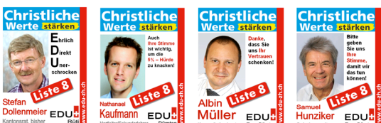
Mit solchen Inseraten werben wir im "Rütner". Danke, wenn Sie uns dazu finanziell unterstützen.

Auch diesmal ist die 5%-Hürde für die EDU ein Hindernis vor der Schlussverteilung. Obschon es vor vier Jahren gut reichte, sind wir wieder auf jede Stimme angewiesen. Bitte lassen Sie sich auch dieses Jahr in Bewegung setzen!